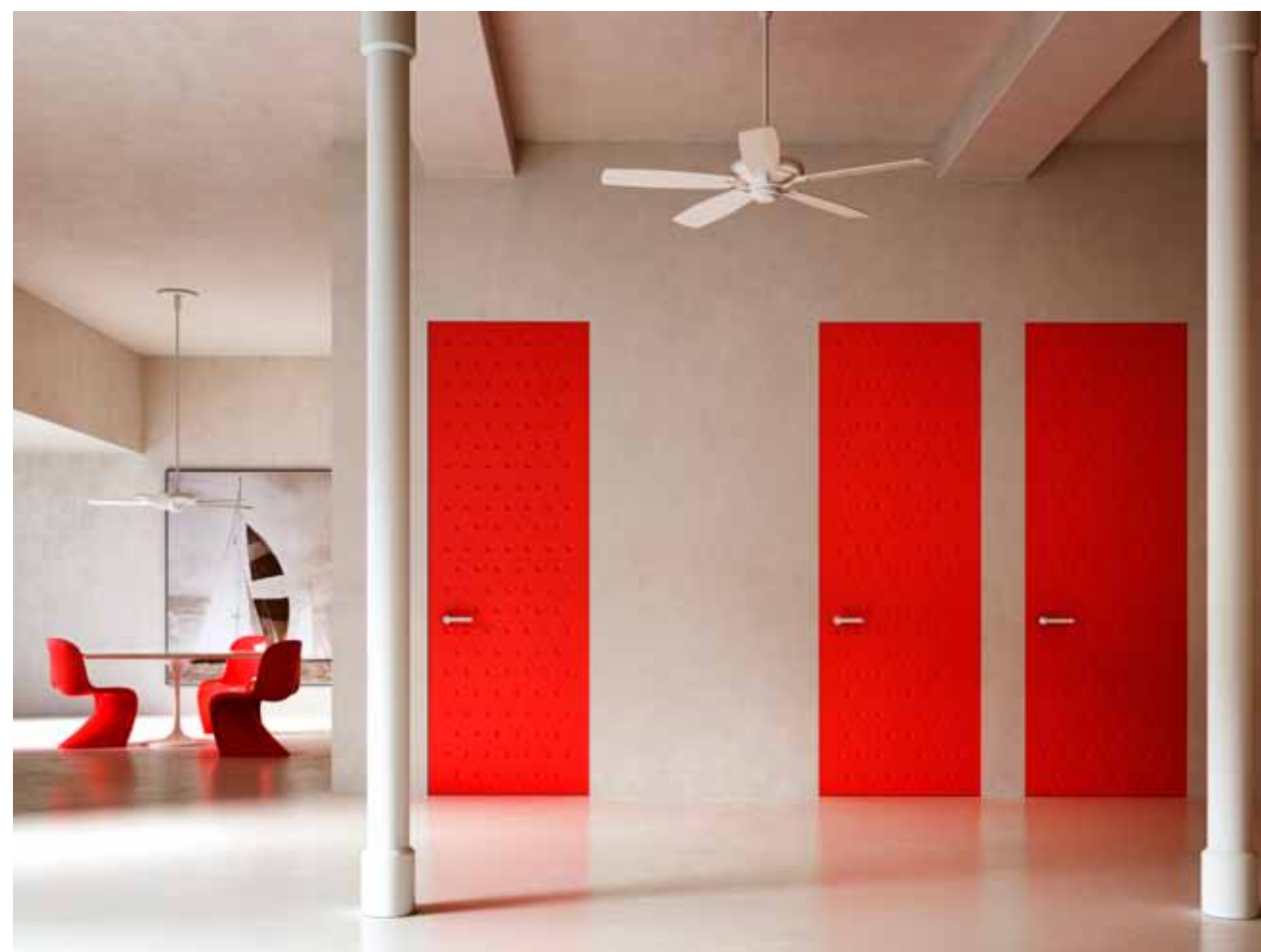
ALBA | PORTA A BATTENTE | Finitura laccata opaca e pantografata

Dietro al nostro lavoro si nasconde una storia tutta italiana fatta di design e grande esperienza. L'elevato know how mascherato dall'apparente semplicità della porta filo muro, insieme all'altissimo grado di "customizzazione" dei progetti, permette di soddisfare anche i più esigenti desideri estetici e funzionali.